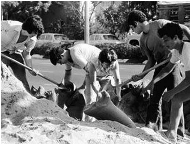
בני נוער ממלאים שקי חול במלחמת יום הכיפורים | כשני העשורים האחרונים חל פיחות בהערכת היכולות של בני הנוער

פיקוד העורף מציב בכל רשות מקומית יחידת קישור לרשות (יקל"ר) המונה לרוב שמונה קציני מילואים. תפקידה של יחידת הקישור הוא לסייע לניהול הרשות המקומית בעת חירום - בין היתר באמצעות הפעלת מתנדבים על פי הצרכים שעולים מהשטח. היקל"ר נמצא בקשר עם מערך המתנדבים המחוזי והפיקודי, ובמידת הצורך ניתן לנייד מתנדבים מרשות לרשות.